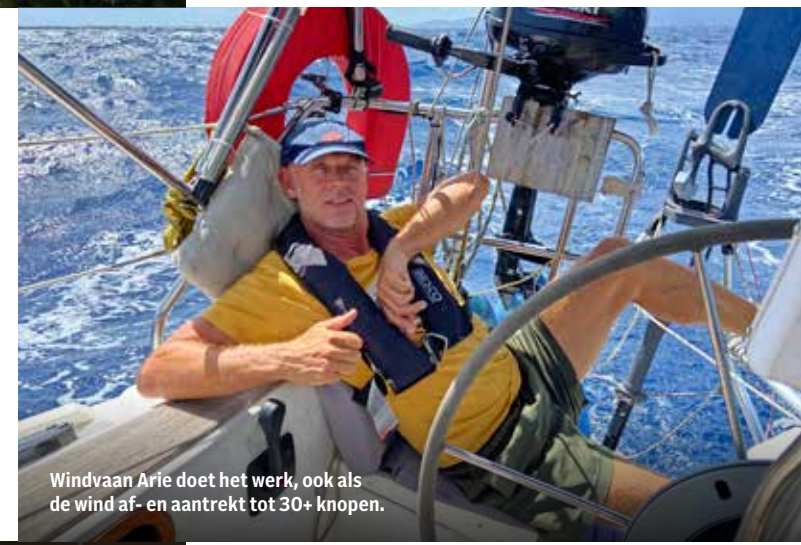
Windvaan Arie doet het werk, ook als de wind af- en aantrekt tot 30+ knopen.

Veerkrachtig Montserrat De wind trekt aan tot ruim 30 knopen als we de zuidwestkust van Montserrat naderen. Dit eiland werd wereldnieuws in 1995, door de eerste van een reeks vulkaanuitbarstingen. De laatste uitbarsting in 2010 maakte maar liefst twee derde van het eiland onbewoonbaar. Wonderlijk genoeg wisten de meeste bewoners tijdig een veilig heenkomen te zoeken, maar hun huizen waren vernietigd. Meer dan de helft van