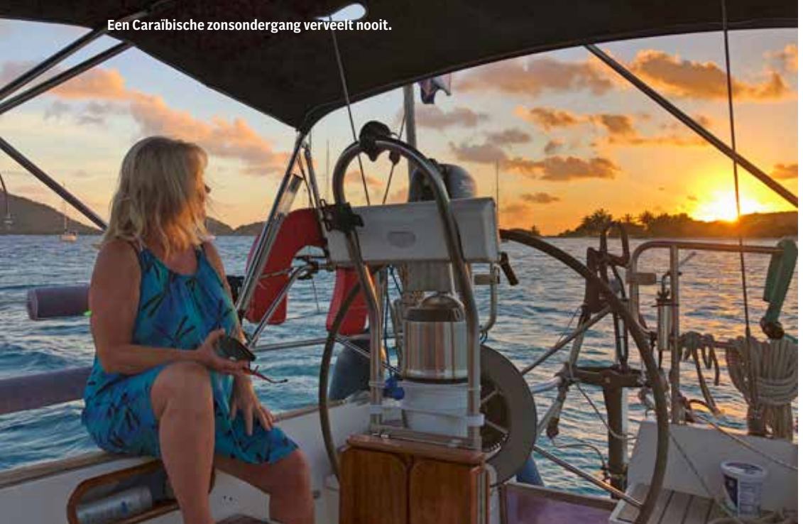
Een Caraïbische zonsondergang verveelt nooit.