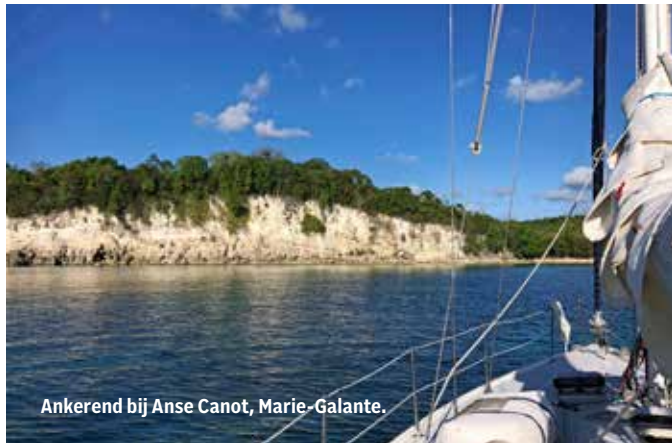
Ankerend bij Anse Canot, Marie-Galante.