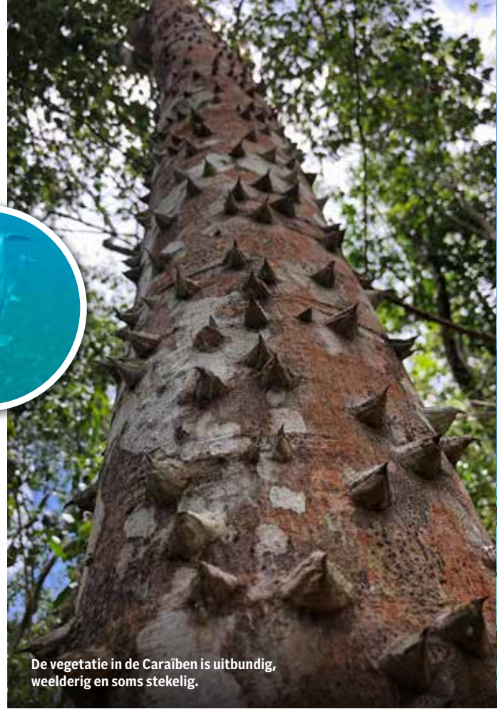
De vegetatie in de Caraïben is uitbundig, weelderig en soms stekelig.