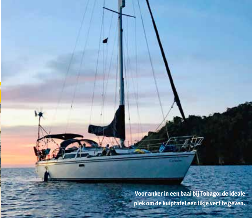
Voor anker in een baai bij Tobago: de ideale plek om de kuipafel een likje verf te geven.