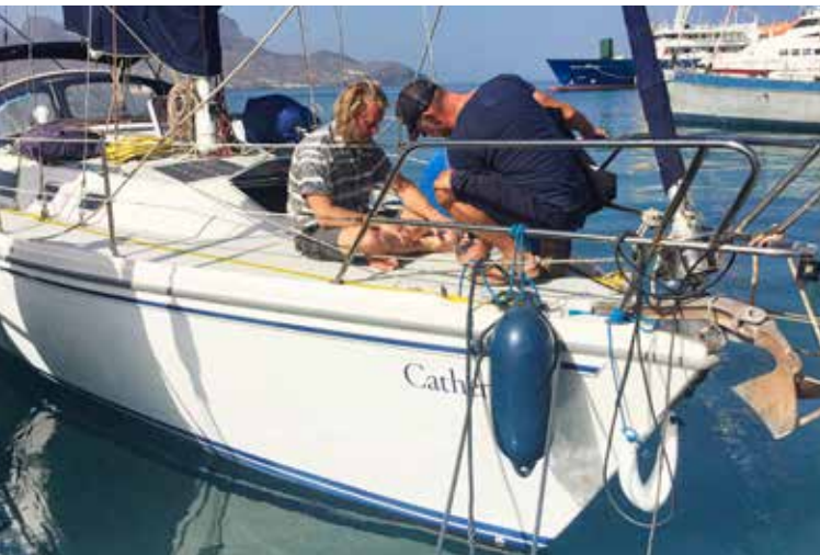
◀ Aan de steiger van Mindelo, springplank voor de oceaan-oversteek. ▼ Na aankomst liggen we in de baai van Île Royale.

De volgende dag maken we een plan voor een stevigere, betere noodoplossing. We willen het voorstag aan een oog op het boegbeslag bevestigen. Daarvoor moet eerst de genaue worden geborgen, daarna de rolreefinstallatie worden gedemonteerd, om bij de spanner van het voorstag te kunnen komen, die losser te draaien en ruimte te maken voor de noodverbinding. Gelukkig werkt de wind mee: een knoop of vijftien, zodat we de genaue onder controle houden en snel aan dek weten te krijgen. Dan begint de demontage van de rolreefinstallatie. Alles zit enorm vast